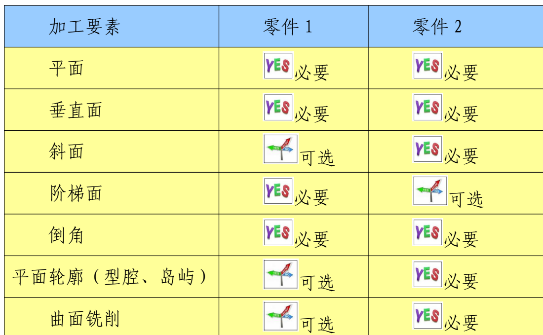
表 1 竞赛命题要素